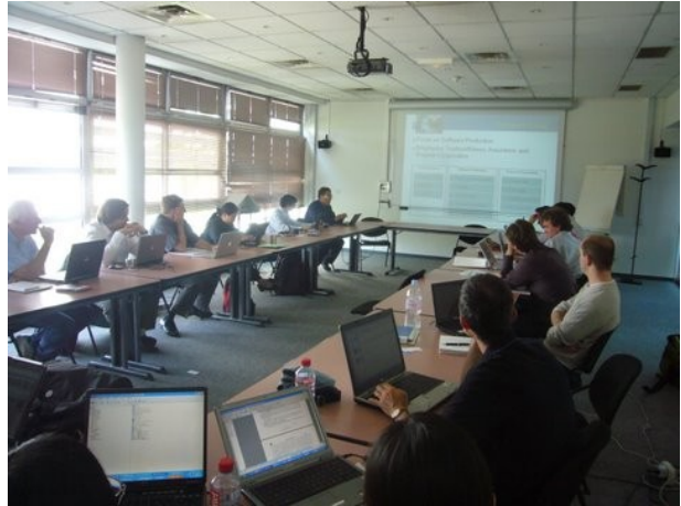
OW2 Technology Council meeting, INRIA Grenoble, France (May 08)