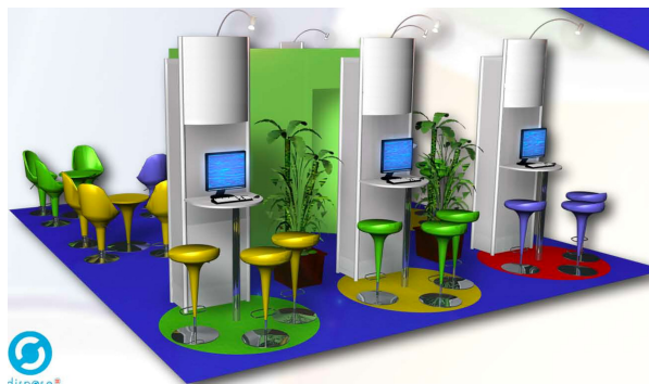
(Booth construction plan for 2008 OW2 Village, Non contractual document)

The OW2 Village will stand out as a high-profile, international area dedicated to open source middleware. It will be conveniently located on Solutions Linux show floor, close to the main cross way and the entrance to the exhibition (see floor plan on next page).