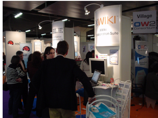
OW2 Village pictures, Solutions Linux, Paris, France (Feb. 08)

Depending on their sponsorship packages, conference sponsors will be provided with a fully equipped turnkey mini booth in the OW2 Village (see more details below). Each member present is guaranteed individual visibility.