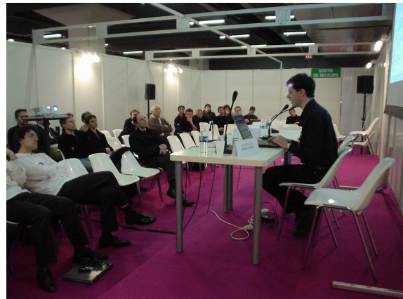
OW2 Conference Session, Solutions Linux, Paris, France (Feb. 08)