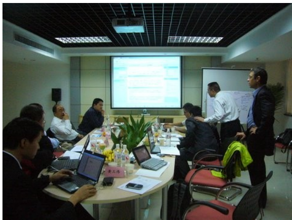
OW2 China Local Chapter meeting, CVIC-SE, Changsha, China (Oct. 08)

The organization committee will be made up of active community members from both the academic and industry sectors and will include members from Europe, China and Brazil.